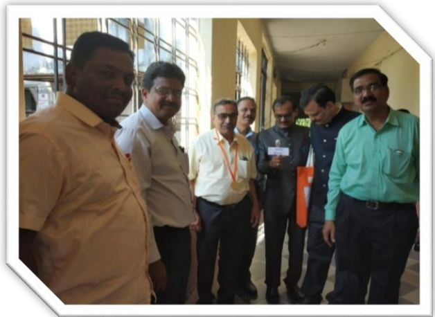
“CHALTA BOLTA” EVENT