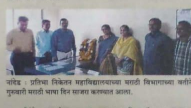
नांदेड : प्रतिभा निकेतन महाविद्यालयाच्या मराठी विभागाच्या वतीने गुरुवारी मराठी भाषा दिन साजरा करण्यात आला.