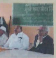
नांदेड : वाजेगाव येथील साहित्यिक डॉ. फुले विद्यालयात कुमुदायज यांच्या प्रतिमेचे पूजन करून अभिवादन करण्यात आले.