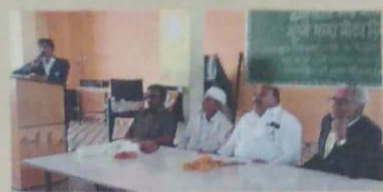
नांदेड : लालू रोडवरील राजकीय मंडळांमध्ये मराठी भाषा दिन उत्साहात साजरा करण्यात आला.

साहित्यकार डॉ. फुले हत्यमकूल व उच्च माध्यमिक विद्यालयात जागतिक मराठी भाषा दिन साजरा करण्यात आला. याप्रसंगी मराठी भाषा अजयना करणारे साहित्यिक वी.