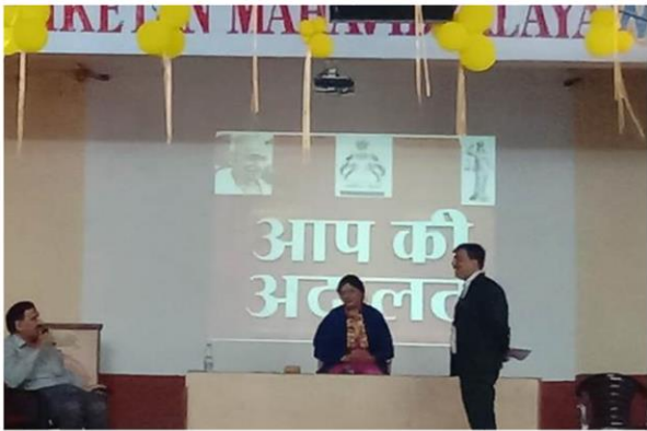
“AAP KI ADALAT”