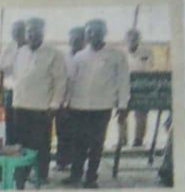
नांदेड : वाजेगाव येथील साहित्यिक डॉ. फुले विद्यालयात कुमुदायज यांच्या प्रतिमेचे पूजन करून अभिवादन करण्यात आले.