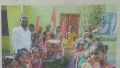
नांदेड : फत्तेपूर जिल्हा परिषद प्राथमिक शाळातील विद्यार्थ्यांनी मराठी दिनानिमित्त प्रथमिती काढली होती.