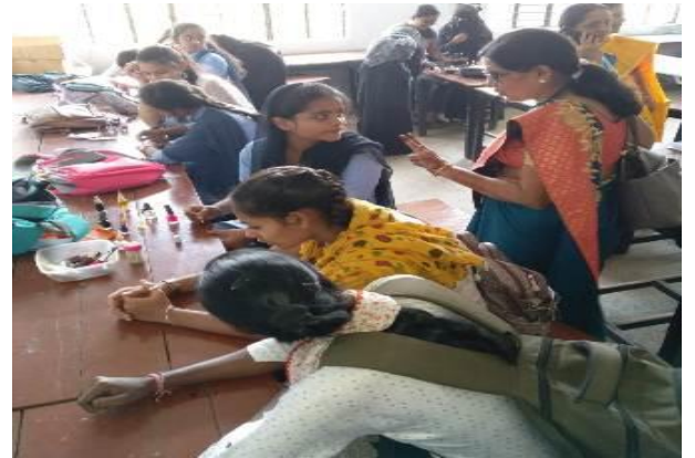
“BEST OUT OF WEST”