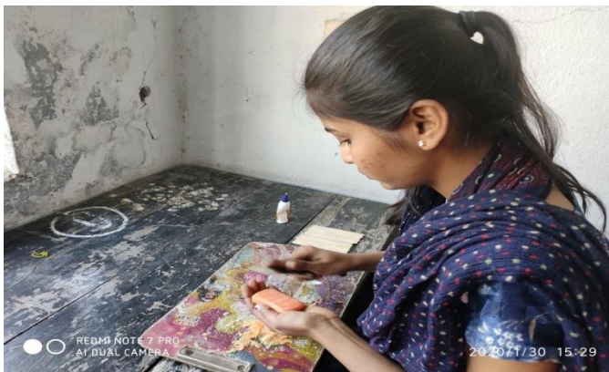
“ SOAP CARVING”