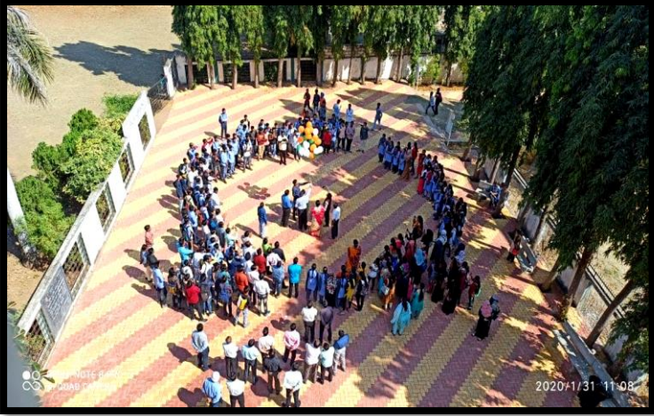
Inaguratgion of Spark 2020